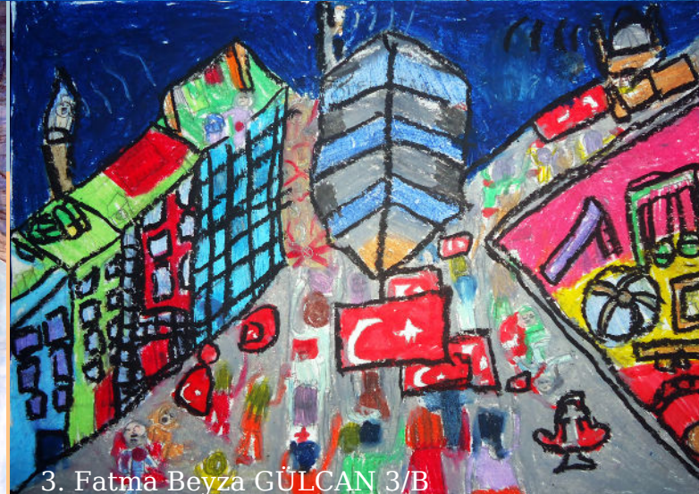
3. Fatma Beyza GÜLCAN 3/B