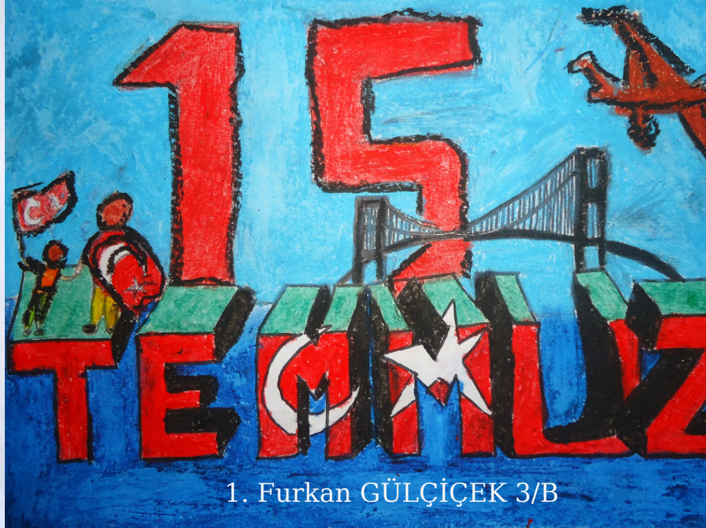
1. Furkan GÜLÇİÇEK 3/B

Millet fek yürek olu Bütün plan bozuldu.