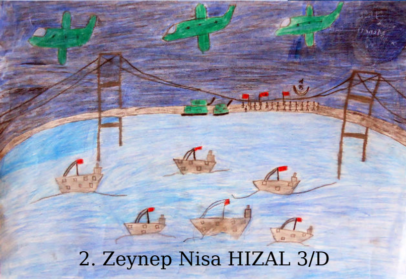
2. Zeynep Nisa HIZAL 3/D