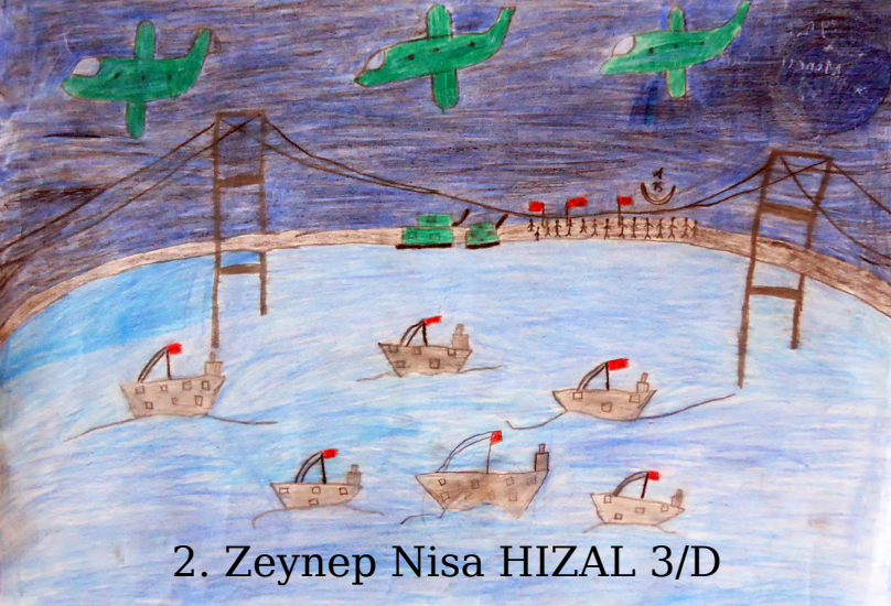
2. Zeynep Nisa HIZAL 3/D