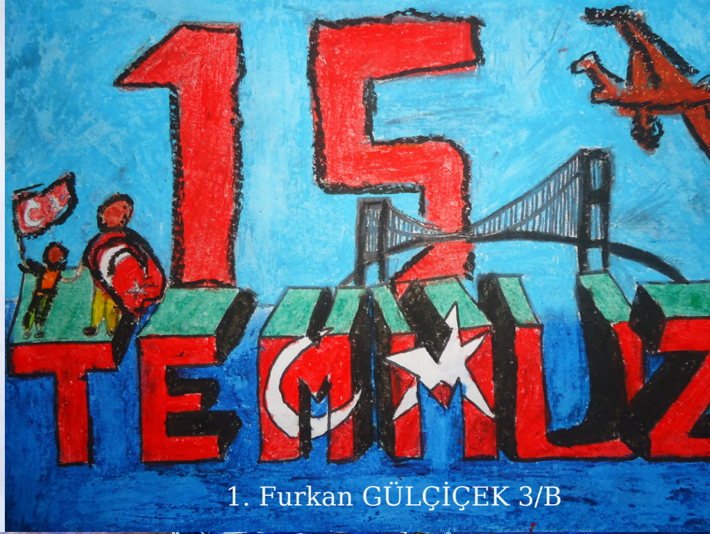
1. Furkan GÜLÇİÇEK 3/B

Millet fevkalade yürekli Bütün plan bozuldu.