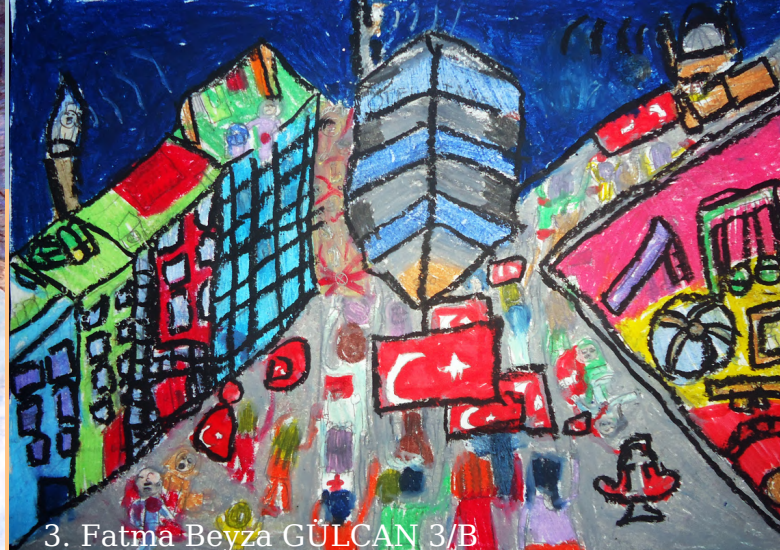
3. Fatma Beyza GÜLCAN 3/B